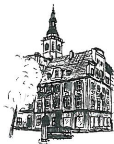
Rynek Wieża ratuszowa