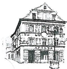
Kamienica „Pod Bykami”