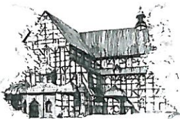
Kościół Pokoju pw. Św. Trójcy Wpisany na listę UNESCO