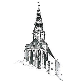
Kościół pw. Św. Stanisława i Św. Wacława Katedra Diecezji Świdnickiej